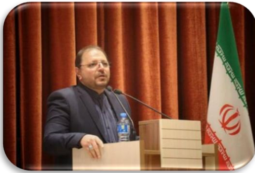
به نام خدا

رشد پرشتاب ارتقاء سطح درآمد جامعه، ایجاد شرایط اشتغال کامل، کاهش نرخ بیکاری، توجه به فعالیت های دانش بنیان، ایجاد شرایط رقابتی، رشد بهره وری، مهار تورم و افزایش قدرت خرید مردم، کاهش فاصله طبقاتی، توجه به محیط زیست ، ... برخی از شاخص های مورد توجه می باشد.