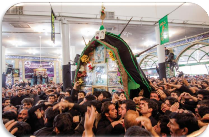
آیین سنتی نخل گردانی روز عاشورا