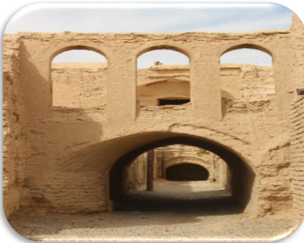
بافت روستای تاریخی بیابانگ