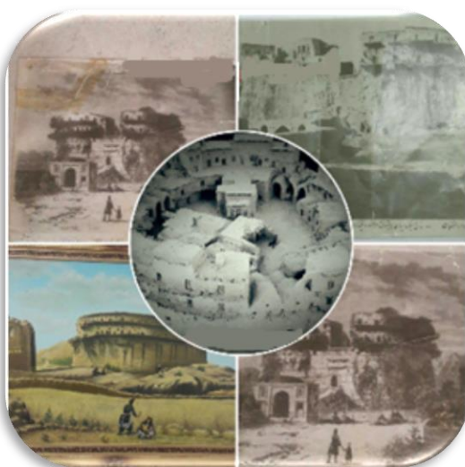
قلعه تاریخی بلاشگرد