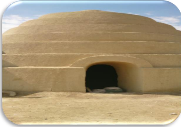
یخچال تاریخی روستای بیابانگ

- آب انبار و یخچال روستا - بافت تاریخی روستا - پالانه پز خانه - کویر جنوب شهرستان - همای سعادت