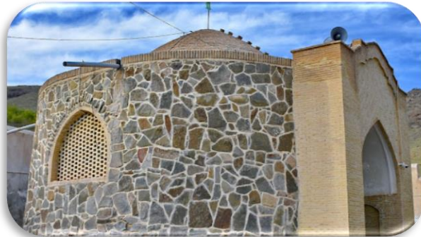
روستای امام زاده عبدا...: امام زاده عبدا... و اسماعیل