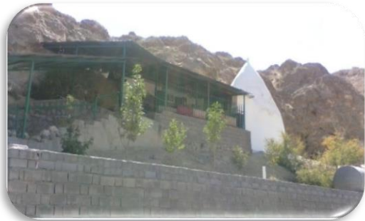
امامزاده علی افتر - بام افتر