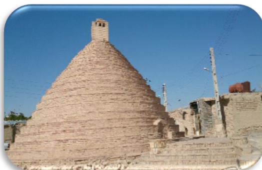
آب انبار روستای تاریخی بیابانک