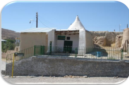
امامزاده طاهر افتر