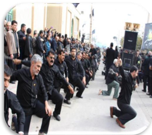
آیین سنتی زانو زدن