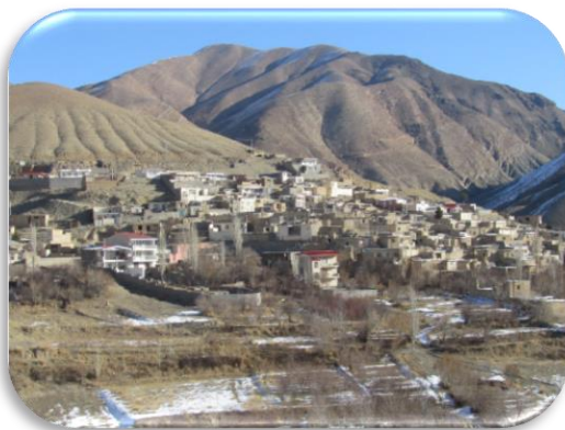
نمایی از روستای تاریخی ایج