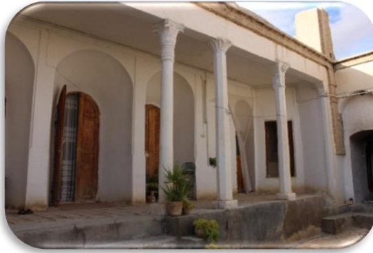
خانه ساسانی لاسجرد / دوره قاجاریه