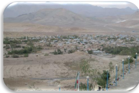
نمایی از روستای افتر - سرزمین گل‌های زنبق

- امام زاده طاهر - امام زاده علی - امام زاده اسماعیل - امام زاده قاسم - مغار افتر