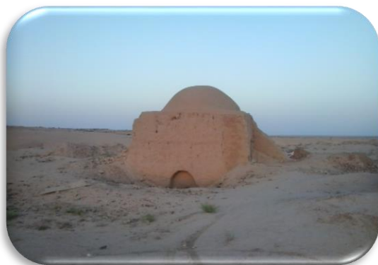
پالانه پز خانه بیابانک