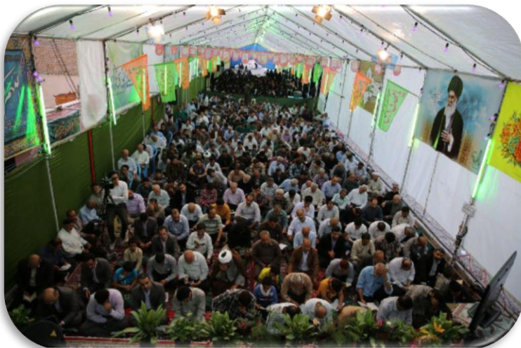
آیین سنتی انتظار